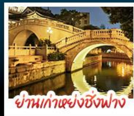
ย่านเก่าแห่งซิงฟาง