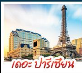
เดอะ ปารีสเซียน

สัมผัสบรรยากาศ เดอะ เวเนเซียน มาท้าวูไ้ เสมือนได้เยือนลาสเวกัส ชมความวิจิตรตระการตาของพระราชวังหยวนหมิงหยวนใหม่แห่งจูไห่ เช็กอินที่แลนด์มาร์กสุดฮิตจตุรัสฮวาอิงถ่ายุรูปกับหอทีวีของกวางเจา เที่ยวชมหมู่บ้านสไตล์ยุโรปแห่งใหม่ของเซินเจิ้น • ช้อปปิ้งเพลิน ๆ ที่ ห้างสรรพสินค้า COCO PARK ถนนคนเดินฟู้หัวสี่และถนนคนเดินบิกทิง