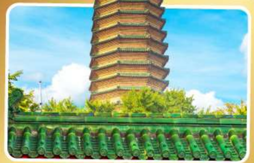
วัดพระเจี๊ยะท้าว

เมนูพิเศษ เปิดปีกกึ่ง, ซาหมูหม้อไฟ อาหารกวางตุ้ง, อาหารเสฉวน