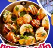
หอยเอสคาร์โก