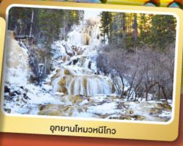
อุทยานโหมวหนีโกว