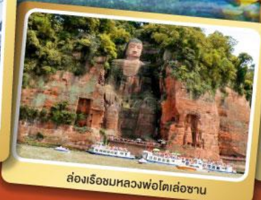
ส่องเรือชมหลวงพ่โตเล่อซาน