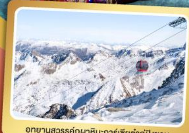
อุทยานสวรรค์ภูผาหิมะการ์เซียตำกูปิงชวณ