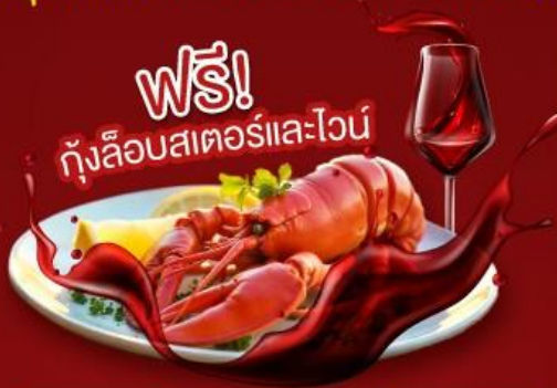
ฟรี! กุ้งล็อบสเตอร์และไวน์