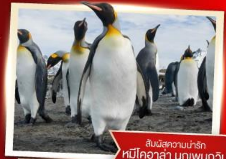
สัมผัสความน่ารัก หมีโคอาล่า นกเพนกวิน