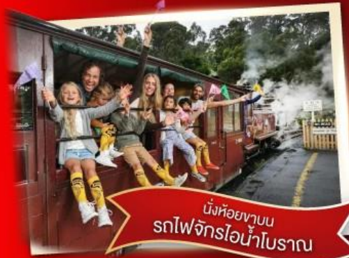
นั่งท่องเที่ยวบน รถไฟจักรไอน้ำโบราณ