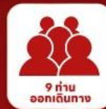
9 ท่าน ออกเดินทาง