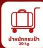
นำสัมภาระเข้า 20 kg