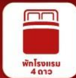
พักรูมแรม 4 คืน