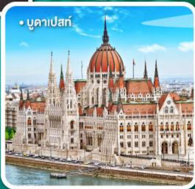
• บูคาเปสต์

เมนูพิเศษ เปิดโบฮีเมีย, เปิดปีกกึ่ง ชุปกุลาซ, ซีโครงหมู และ หมุกอดเวียนนา