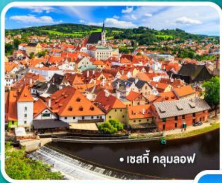
• เซสกี คลุสอพอ