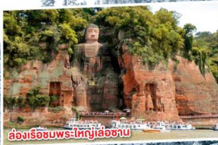
ล่องเรือชมพระใหญ่เล่อซาน