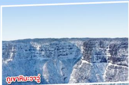
ภูเขาหิมะวางู๋