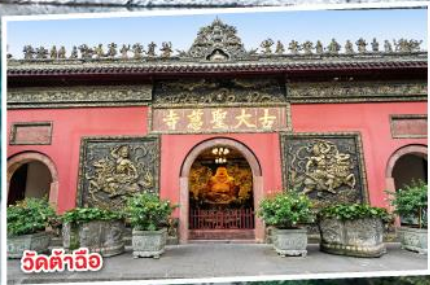
วัดต้าฉี