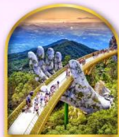
สะพานมือยักษ์