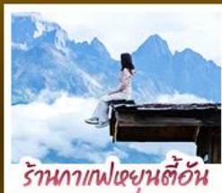
ร้านอาหารฟงชุนตันอัน

ชมวิวภูเขาหิมะสวยสุดโรแมนติกกับแสงยามพลบค่ำ เที่ยวเมืองโบราณต้าหลี่ ลี้เจียง ป่าชา แซงกรี่ล่า ชมวิถีชีวิตของชุมชนยูนนานและทิเบต พิสูจน์ความกล้าท้าเดินชมสะพานแก้วลี้เจียง • ซุปโป่งเพลินที่ถนนคนเดินหนานผิงเจียง