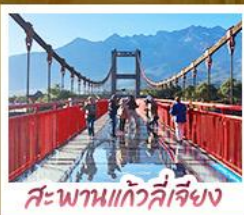
สะพานแก้วลี้เจียง