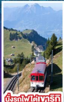
นั่งรถไฟใต้เขาริกิ