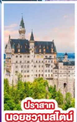
ปราสาท บอยชวานสไตน์