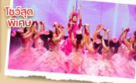
โชว์สุดพิเศษ