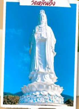
เจ้าแม่กวนอิม วัดเขลิบซิ่ง

เที่ยวสวนสนุกจัดเต็มบนบานาฮิลล์ ชมการแสดงสุดอลังการ เก็บครบทุกไฮไลต์ดัง เมืองดานัง