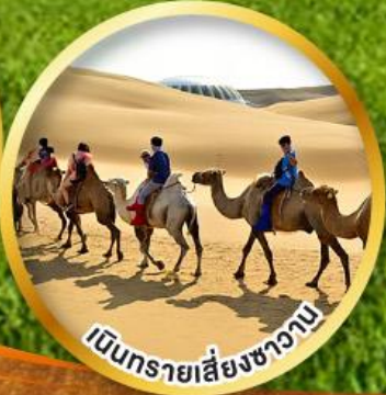
เบ็นทรายเสียงชาวน