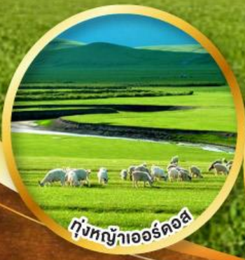
ทุ่งหญ้าเออร์ดอส