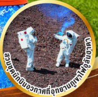
อณูโลกบินอวกาศที่อุทยานภูเขาไฟอูลันฮาตา