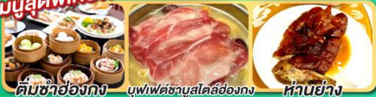
ต้มชาฮ่องกง