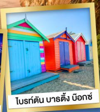
ไบรต์ตัน บาร์ตัง บ็อกซ์