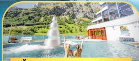
แช่น้ำแร่ร้อนผ่อนคลายลอร์ดคอร์บิต