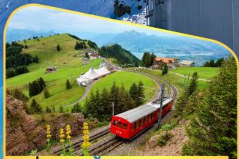
นั่งรถไฟขึ้นสู่ยอดเขาโรทิก