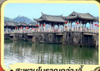
• สะพานโบราณกว้างจี้