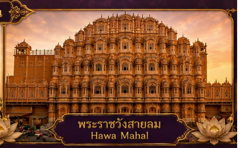
พระราชวังสายลม Hawa Mahal