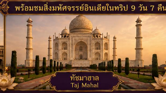
ทัชมาฮาล Taj Mahal