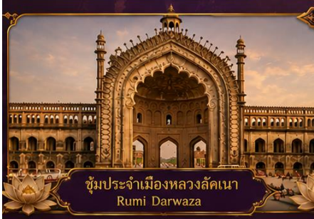
ซุ้มประจำเมืองหลวงลัคเนา Rumi Darwaza

พร้อมชมสิ่งมหัศจรรย์อินเดียในทริป 9 วัน 7 คืน