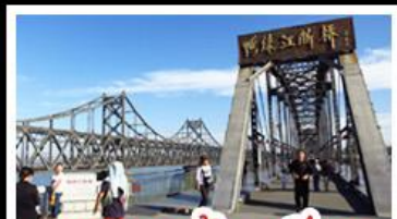
ตามองตัวนฉีเยว