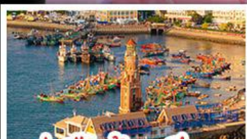
ท่าเรือต้าเหลียน