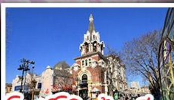
โบสถ์โกธิคต้าเหลียน