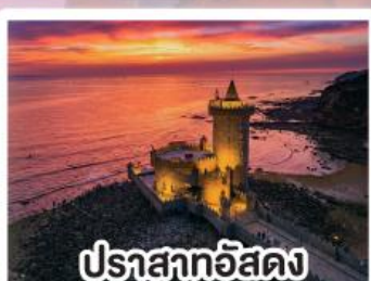
ปราสาทอิสดง