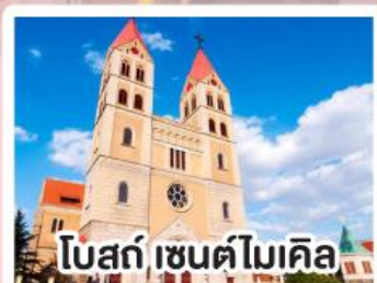
โบสถ์ เซนต์ไมเคิล