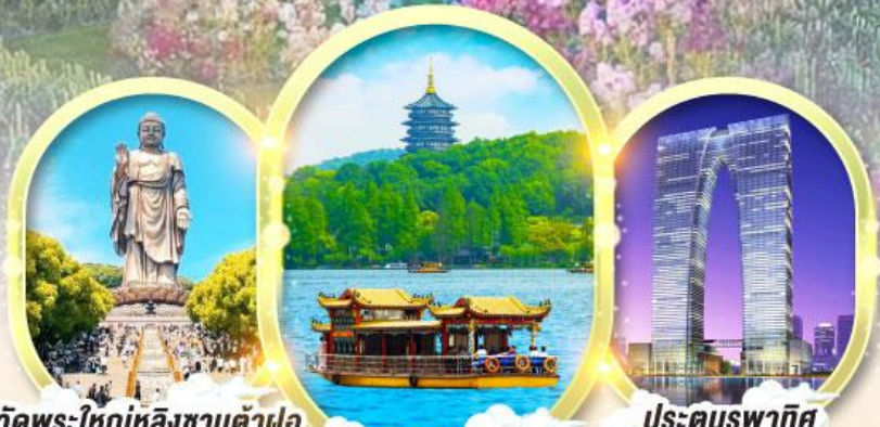
วัดพระใหญ่หลิงซานต้าฝอ (รวมรถแท็กซี่)