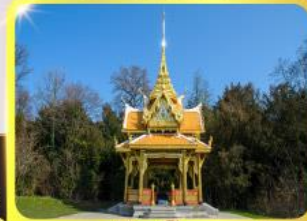
ศาลาไทยไชยาน์

เดินทาง : 02 - 09, 16-23 ก.ย.69 / 07 -14, 22-29 ต.ค.69 04 - 11, 11-18 พ.ย.69 / 25 พ.ย. - 02 ธ.ค.69 03 - 10, 23-30 ธ.ค.69 29 ธ.ค.69 - 05 ม.ค.70