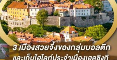
3 เมืองสวยจิ้งของกลุ่มบอลติก และเก็บไฮไลท์ประจำเมืองเฮลซิงกิ และล่องเรือเฟอร์รี่ข้ามประเทศ