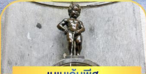
เมเนกันพีส