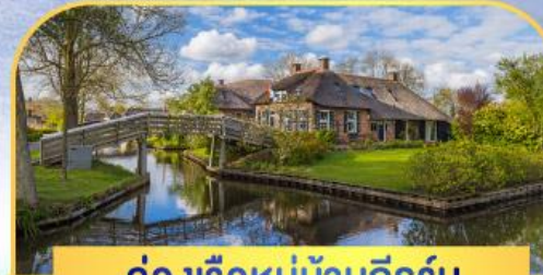
ล่องเรือหมู่บ้านทีรูรัน