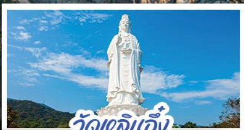
วัดเลิอัน