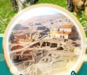
ถ้ำอพลิสต์ซิคห์