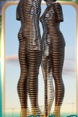
อนุสาวรีย์อัสลีและนิโน