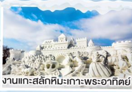
งานแกะสลักหิมะเกาะพระอาทิตย์