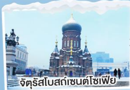
จัตุรัสโบสถ์เซ็นต์โซเฟีย