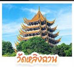
วัดเลิ่งอวอน