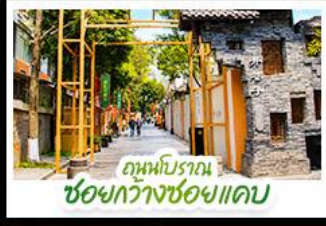
ถนนโบราณ ชอยกวางชอยแคบ