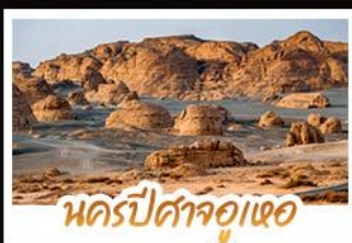
นครปีศาจอูเซอ

หนาวนี้ที่ซินเจียง เราช้อความงามสุดอลังการของอุทยานคานาสีอ เก็บภาพสวยครบทุกพีค ทั้งศาลาขมปลา อ่าวเสี้ยวจินตรา อ่าวซอมนังกร และอ่าวเทพทเวด้า • นอนพักค้างคืนในกระท่อมไม้ ภายในหมู่บ้านเหมอู่ ตีบเข้ามาสู่อากาศบริสุทธิ์และชื่นจุดชมวิวน้ำพุร้อนที่ปกคลุมราวกับเมืองในฝัน นั่งรถไฟชมวินคริปัสจิวทอ • ช้อปปิ้งของฝากที่ตลาดแกรนด์บาซาร์ เมืองอู่จู่ตี