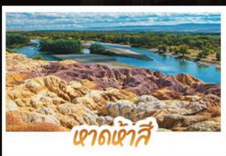
เขาดงเคาซี