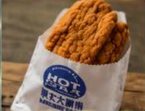
ไก่ทอดฮ็อตสตาร์ ไก่ทอดชิ้นใหญ่กรอบนอก นุ่มใน รสชาติที่ใครมาไต้หวันต้องลอง