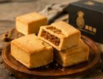
พายสี่เหลี่ยมสอดไส้ถั่ว พายสี่เหลี่ยมสอดหอยหวาน ของฝากยอดนิยมจากไต้หวัน