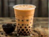
ชานมไข่มุก ชานมหอมละมุน ไข่มุกเหนียวนุ่ม เครื่องเคียงยอดฮิตระดับโลก