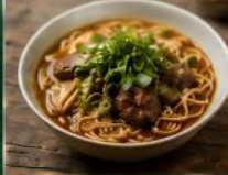
บะหมี่บ๊อง บะหมี่เนื้อตุ๋นสุอรัดต้นตำรับ หอมฉุนุ่มกลมกล่อม

แหล่งรวมอาหารท้องถิ่นและของฝากยอดนิยมของไต้หวัน อาทิ