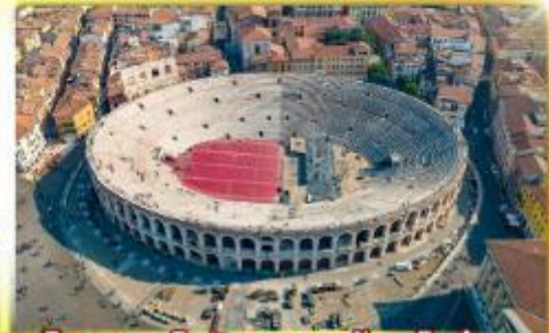
โรงละครโรมันกลางจัหวโรม่า