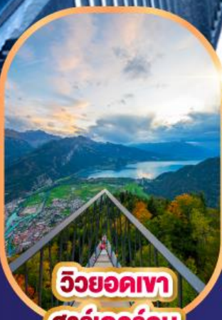
วิวยอดเขา ชาร์เคอร์คุม