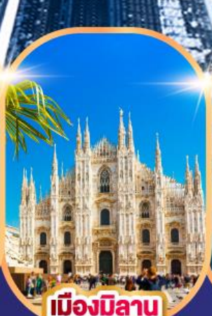
เมืองมิลาน