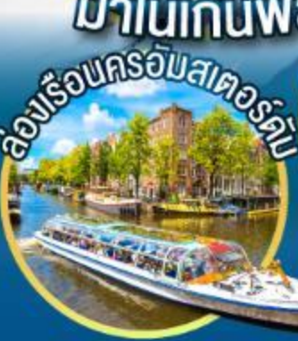
ล่องเรือชมสแตรด์คัม