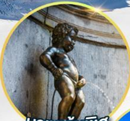
บานกันพิส