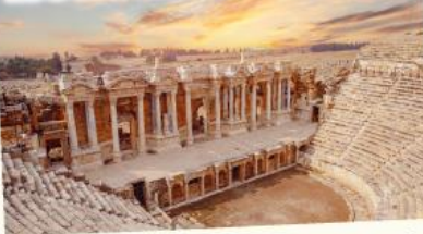
เมืองโบราณเฮียราโพลิส