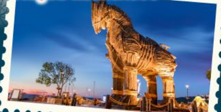
ถ่ายรูปม้าไม้แห่งทรอย

ขึ้นกระเช้าชมวิวสุเหร่าอวยบสุลต่าน และกระเช้ายอดเขาเออร์ซีเยส