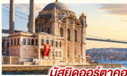
มัสยิดคออร์ดาคอย