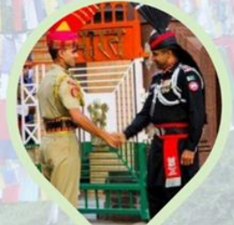
พิธีลดธงพระแดน อินเดีย-ปากีสถาน ชายแดนวากา (Wagah border)