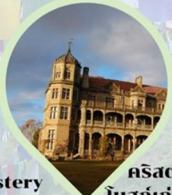
คริสตจักรนีโอโกธิค โบสถ์เก่าแก่ รัฐหิมาจัล