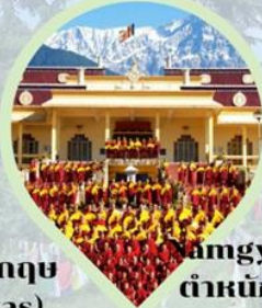
Amgyal Monastery ตำหนักองค์ดาไลลามะ ดาร์มซาล่า