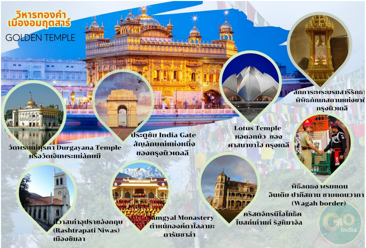
วัดพระแม่สุคา Durgayana Temple หรือวัดเงินพระแม่ลักษมี