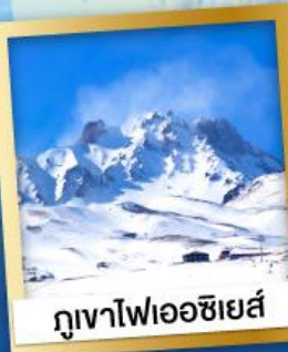
ภูเขาไฟเอซียส์