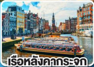
เรือหลังคากระจก