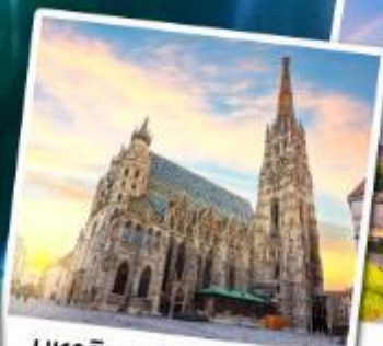
มหาวิหารเซนต์สตีเฟ่น