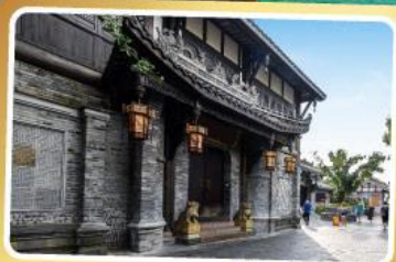
ถนนควานโจ๋เซียงจื่อ