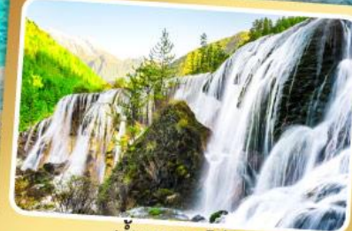
น้ำตกธารไ่่มุก