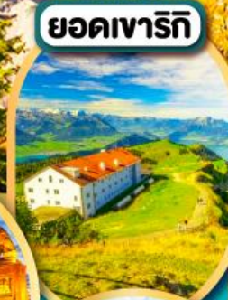
ยอดเขารีกี