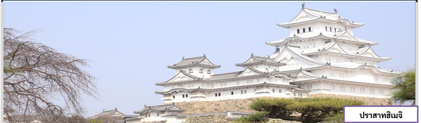
ปราสาทิเมจิ