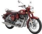
Royal EnfieldClassic 350 (2)