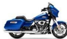
Harley-DavidsonStreet Glide P.7