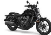
HondaRebel 1100 DCT P.5