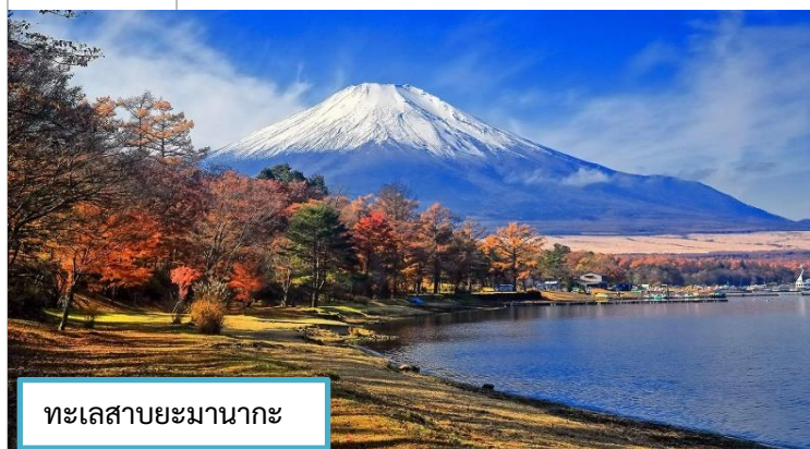
ทะเลสาบยามานากะ