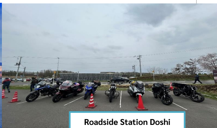
Roadside Station Doshi