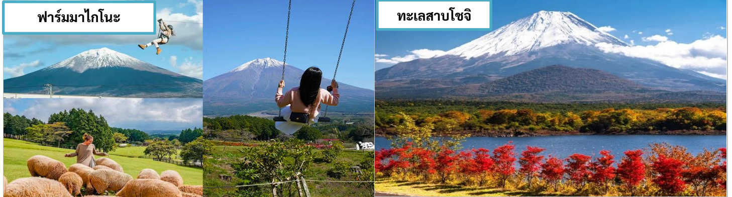
ฟาร์มมาโกโนะ ทะเลสาบโซจิ เที่ยง รับประทานอาหารกลางวัน ณ ทะเลสาบโมโตซุ

ออกเดินทางต่อด้วยรถมอเตอร์ไซด์ มุ่งหน้าสู่ ทะเลสาบโซจิ ทะเลสาบที่เล็กที่สุดในบรรดาทะเลสาบทั้งห้า