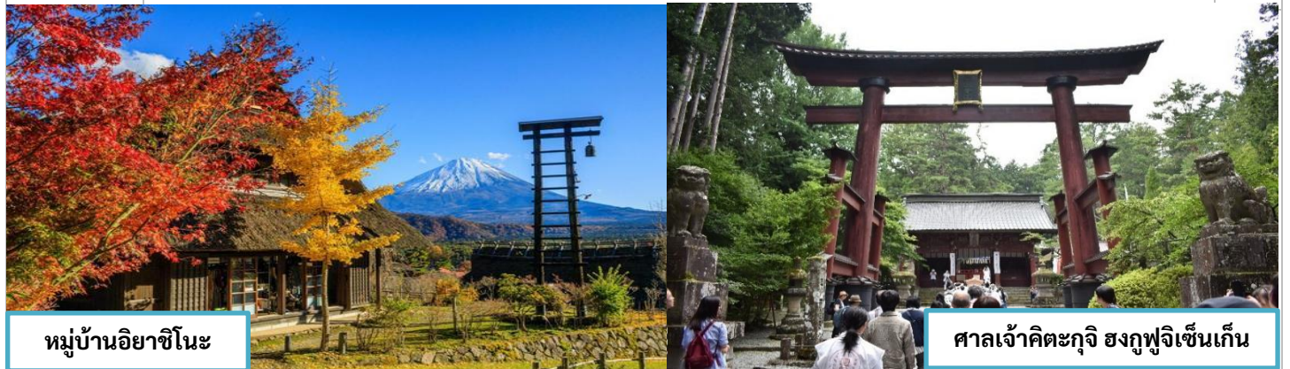
หมู่บ้านอียาชิโนะ ศาลเจ้าคิตะกุจิ ฮงกุฟูจิเซ็นเกิน

ออกเดินทางต่อด้วยรถมอเตอร์ไซด์ มุ่งหน้าสู่ ทะเลสาบโซจิ ทะเลสาบที่เล็กที่สุดในบรรดาทะเลสาบทั้งห้า