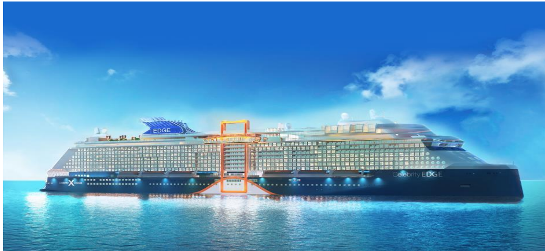
“ Celebrity Egde “