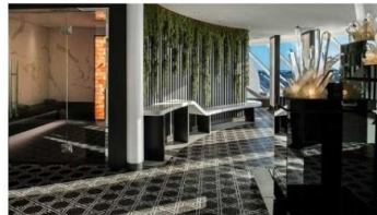
SEA Thermal Suite

Enjoy dining in this exclusive restaurant, featuring inventive dishes crafted by our Michelin-starred chef.