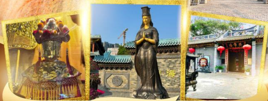
วัดอาม่า