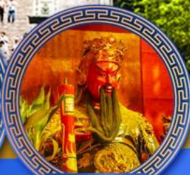
วัดกวนโถ