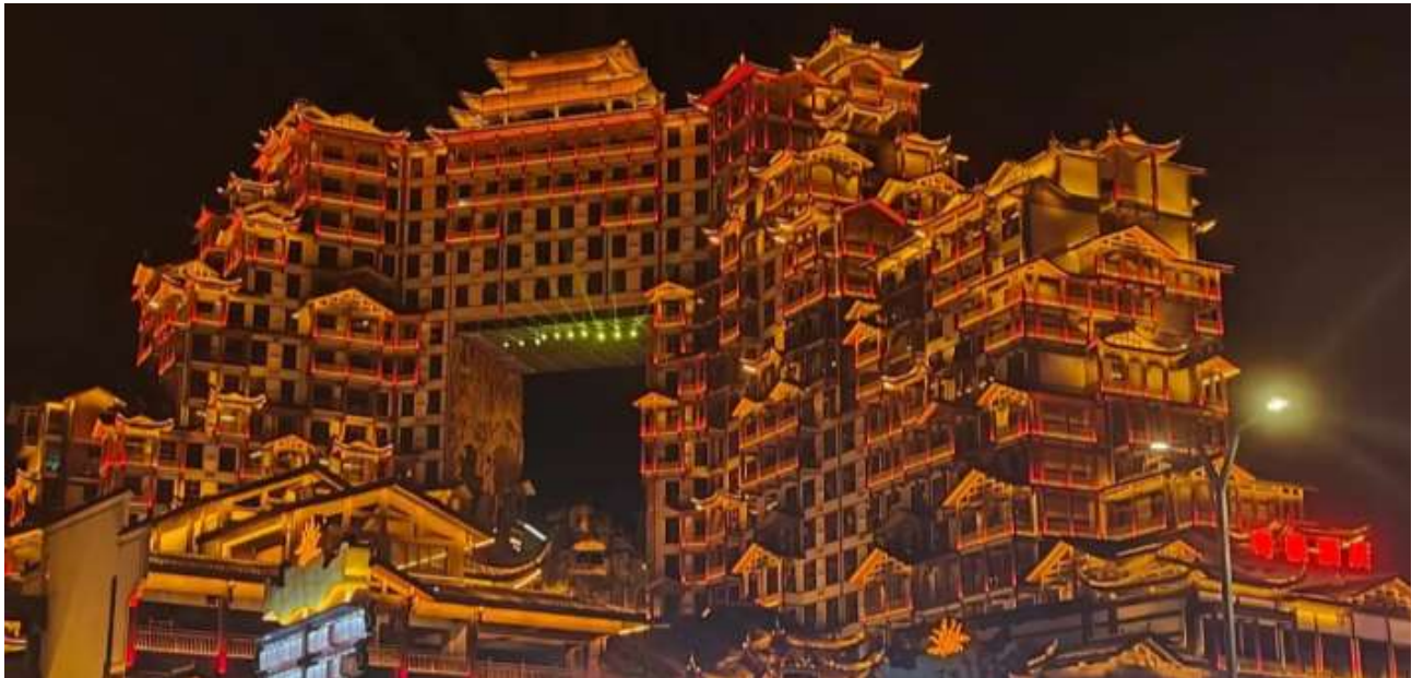
ที่พัก COUNTRY GARDEN PHOENIX HOTEL หรือเทียบเท่าระดับ 5 ดาว (มาตรฐานประเทศจีน)

วันที่สอง บ้านเจ้าเมืองถู่เจีย – เขาเทียนเหมินซาน (รวมกระเช้าขึ้นลง) – ระเบิดงิ้วแก้ว (รวมผ้าห่มรองเท้า) - บันไดเลื่อน 99 ชั้น - ถ้ำประตูสวรรค์ – โข่วจิ้งจอกขาว