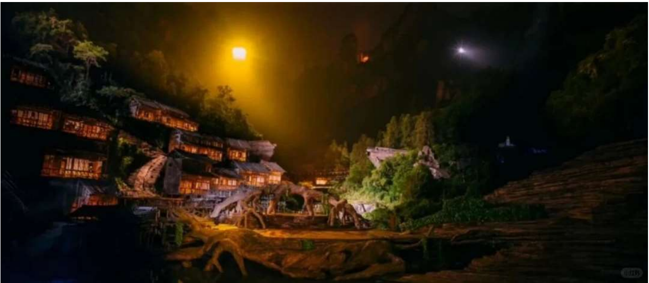
ที่พัก COUNTRY GARDEN PHOENIX HOTELหรือเทียบเท่าระดับ 5 ดาว (มาตรฐานประเทศจีน)

หมายเหตุ หากวันเดินทางดังกล่าวทางโซ่วงดการแสดง ทางบริษัทขอสงวนสิทธิ์เปลี่ยนเป็นโซ่วเสน่ห์เซียงซีแทนหรือโซ่วตำนานรักพันปี โดยไม่ต้องแจ้งให้ทราบล่วงหน้าและไม่มีการคืนค่าใช้จ่ายใดๆทั้งสิ้น